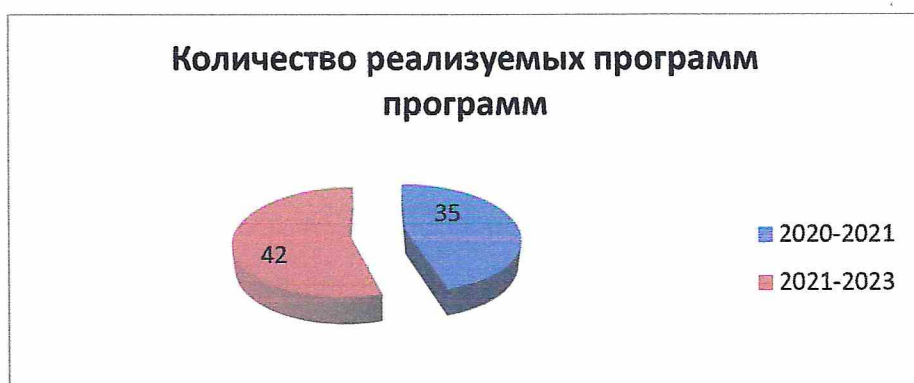
Рис.2. общее количество реализуемых программ

Большинство образовательных программ составляют программы художественной направленности – 36, остается количественно неизменным по сравнению с 2020г., количество программ физкультурно-спортивной направленности - 3 и социально гуманитарной -3.