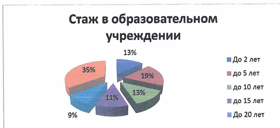
Рис. 4. Кадровое обеспечение образовательного процесса. Стаж в образовательном учреждении.

Уровень квалификации педагогических работников по состоянию на 2023-2024 учебный год