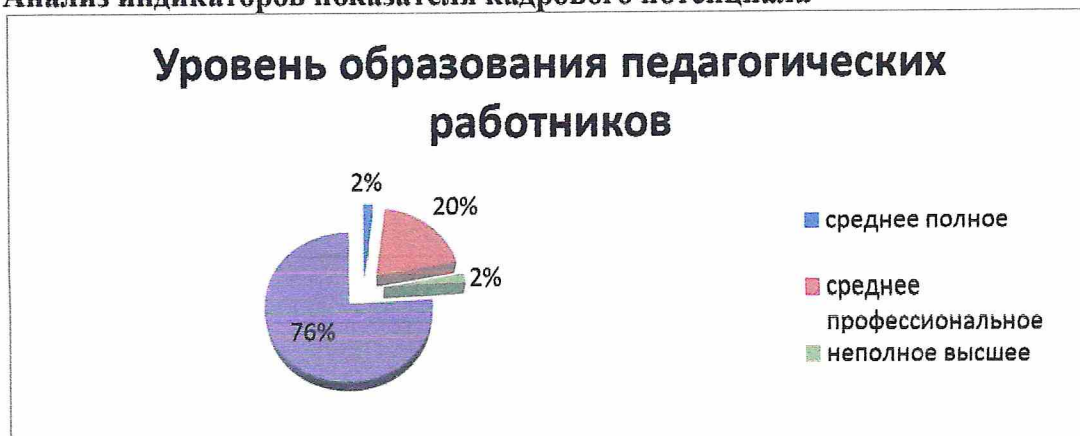
Рис. 3. Кадровое обеспечение образовательного процесса. Образование

Диаграмма отображает качественную картину уровня образования педагогических кадров Учреждения. Так доля сотрудников имеющих высшее образование составляет 76 % от общего числа штатных педагогических работников, 20% имеют среднее профессиональное образование и по 2% - неполное высшее и среднее полное соответственно.